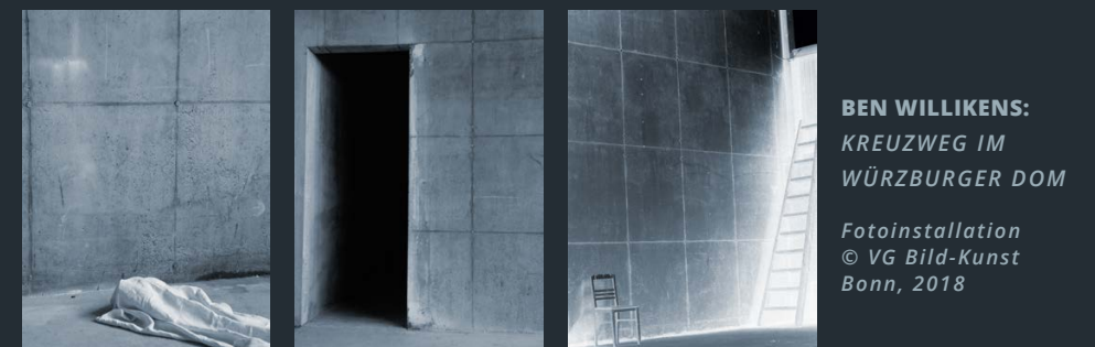
11 ABNAHME UND LEGUNG IN DEN SCHOSS DER MUTTER