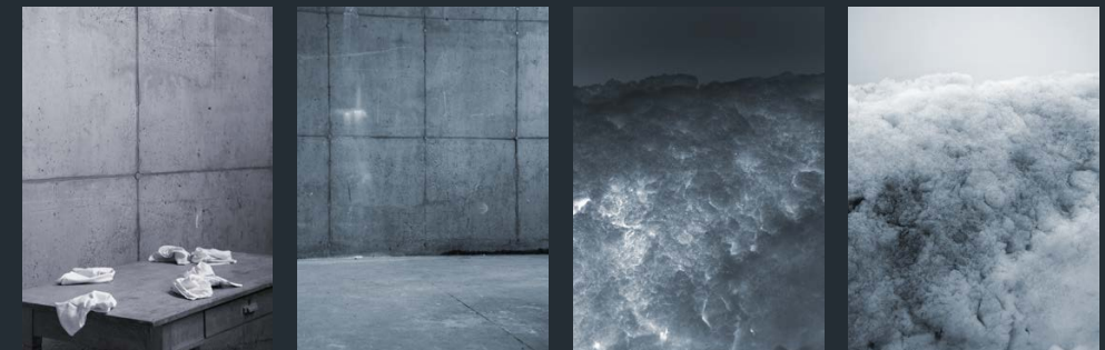
07 DIE WEINENDEN FRAUEN