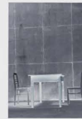
BEN WILLIKENS: TREFFEN DER MUTTER